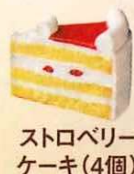
ストロベリー ケーキ(4個)

ストロベリーのケーキと、チョコのケーキの2種類の味を楽しめるクリスマスケーキです。